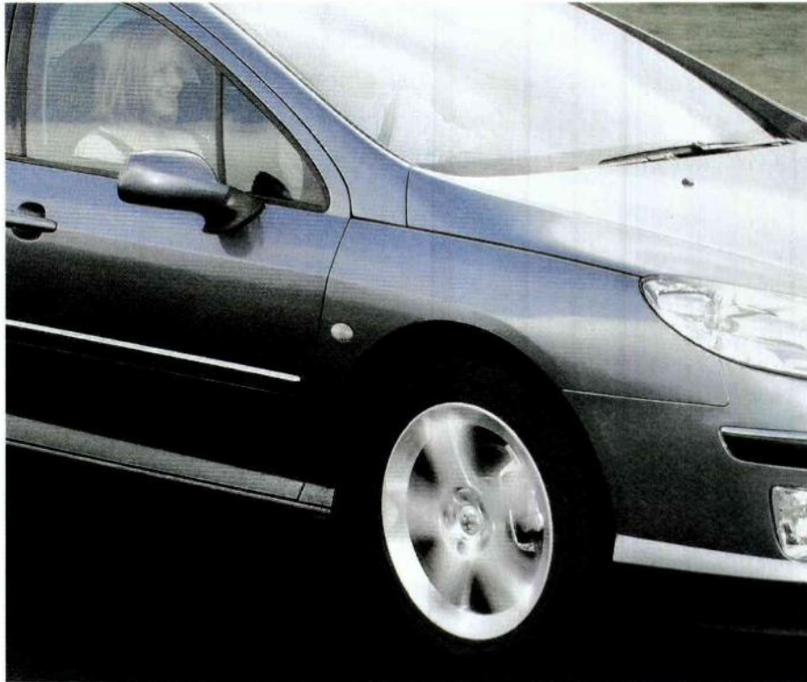
Magnetisch geladen: Stahleinlagen in den Pneus